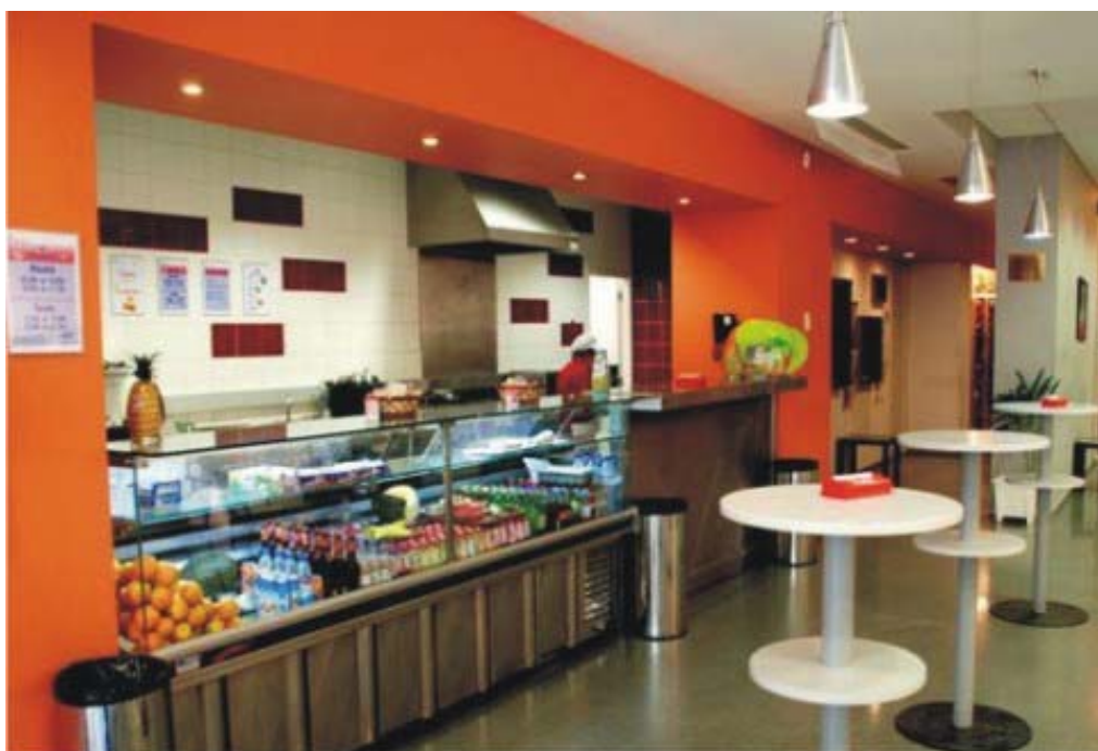
Fotografia do Bar da Sede da Delegação

Por protocolo estabelecido com a nossa Empresa, o Clube EDP tem a gestão de Bares que se destinam a bolos, sandes e, eventualmente, refeições muito ligeiras. Ultrapassando essa incumbência ao fornecer refeições elaboradas e confeccionadas, quantas vezes por empregadas de balcão, temos originado um défice de compreensão por parte de alguns utentes, que vêm posteriormente exigir mais e mais, colocando-nos numa posição de estar a praticar um mau serviço.