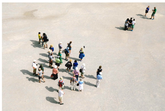
"Peregrinação" de PHOTO de António Manuel Alves Fonseca