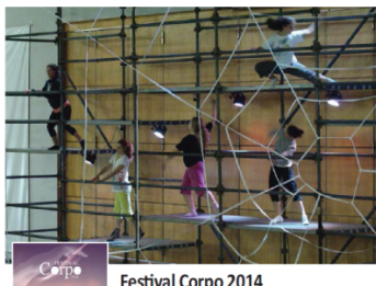
Festival Corpo 2014