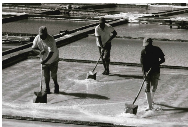
"Salinas" de DUK de Herlander Janeiro Rascão Gomes

A participação de sócios neste concurso foi bastante elevada, com fotografias bastante interessantes, tendo sido difícil a escolha dos vencedores (ver fotos abaixo).