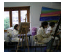
Trabalhos dos alunos do Ateliê de Pintura em exposição de 7 a 20 de Maio