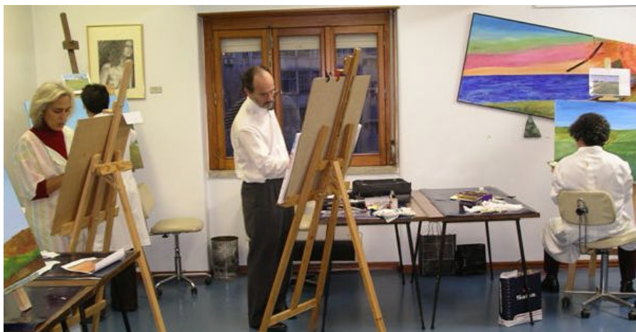
Os trabalhos dos alunos do Ateliê de Pintura vão estar em exposição de 7 a 20 de Maio