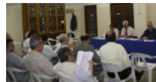
② Reuniu assembleia geral da Delegação