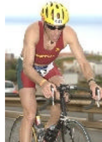
Prova de ciclismo

✓ Campeonato Mundial de Triatlo: Entre 1 200 participantes neste campeonato,