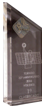
Troféu 30.º aniversário Clube - EDP conquistado pela equipa da Delegação de Lisboa no torneio comemorativo

Concluída a fase final, que foi ganha pelo Vólei Clube do Sul, o Clube EDP classificou-se em 5.º lugar, pelo que, na próxima época, permanecerá na 2.ª categoria.