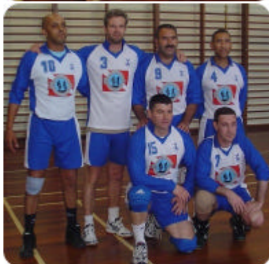
De cima para baixo: equipas do Millenium BCP, SEF e Amigos de Artilharia