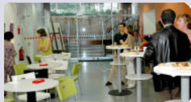
Dois aspectos da inauguração da exposição dos alunos do Ateliê (turma A)