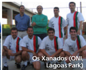
Os Xanados (ONI, Lagoas Park)