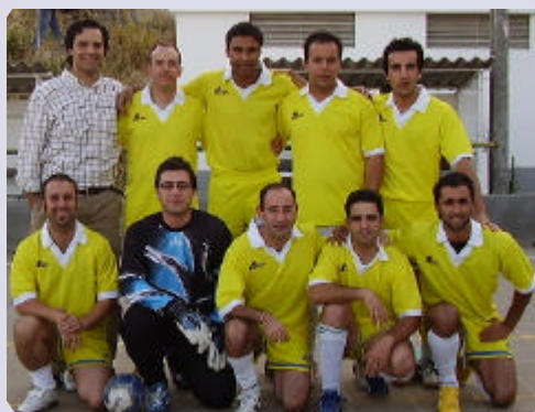
A Funteam (Seleccção de Sacavém) conquistou com brilhantismo o 1.º lugar do torneio

Com a participação de 11 equipas, o torneio foi vencido pela Funteam, ficando nos lugares de honra as equipas Bohemia e os Xanados. Por sua vez, a GSPRO venceu o troféu disciplina. Os Marqueses 2006 foi desqualificada por ter cometido duas faltas de comparecência (resultados dos últimos jogos e classificação das equipas na Pág.ª 2).