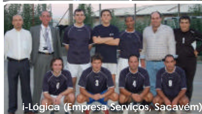
i-Lógica (Empresa Serviços, Sacavém)