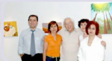
Dois momentos da abertura da exposição dos alunos do Ateliê (turma B)