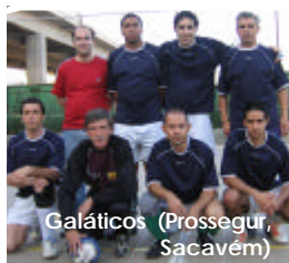
Galáticos (Prosegur, Sacavém)