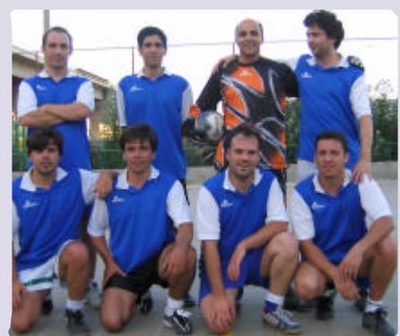
A GSPRO (empresa de Sacavém) foi a vencedora do troféu disciplina