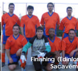
Finishing (Edinfor, Sacavém)