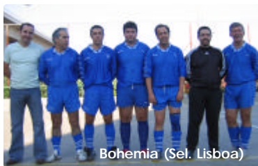
Bohemia (Sel. Lisboa)

A GSPRO venceu o Troféu Disciplina, seguida dos Galáticos e Palhavã II.