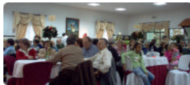
17 de Novembro: almoço comemorativo dos 30 anos do Clube EDP que juntou cerca de 200 participantes.