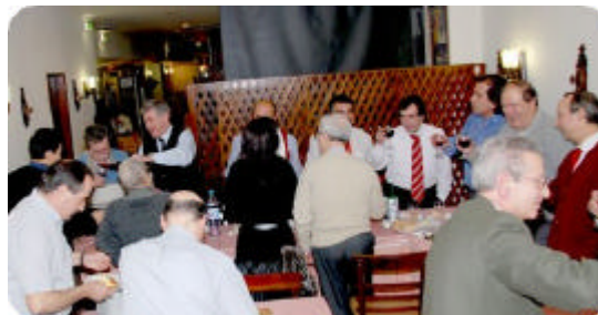
Imagem do habitual jantar de Natal dos órgãos sociais da Delegação de Lisboa que teve este ano lugar no dia 20 de Dezembro.