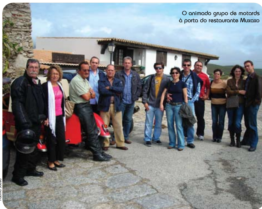
O animado grupo de motards à porta do restaurante Muxaxo

Dado o êxito da iniciativa, estamos já a pensar em organizar um novo passeio, mas desta vez em Moto 4. Por isso, esteja atento!