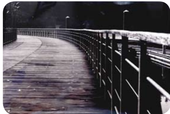
1º prémio - "O ESTRADO", de Carlos Bento Santana, Setúbal