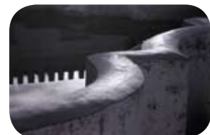
2º prémio "ESPELHO MEU", de António Manuel Fonseca, Amadora