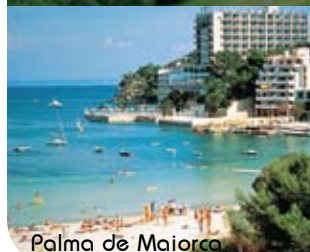
Palma de Maiorca