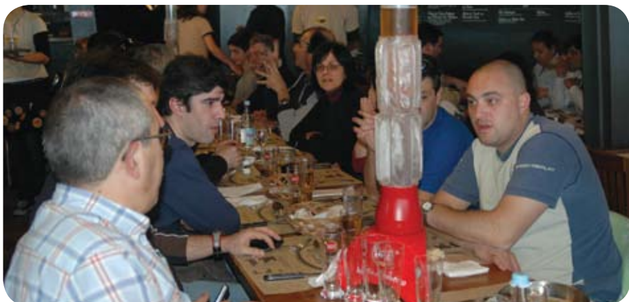
Motards de Vila do Conde; Porto e Leiria