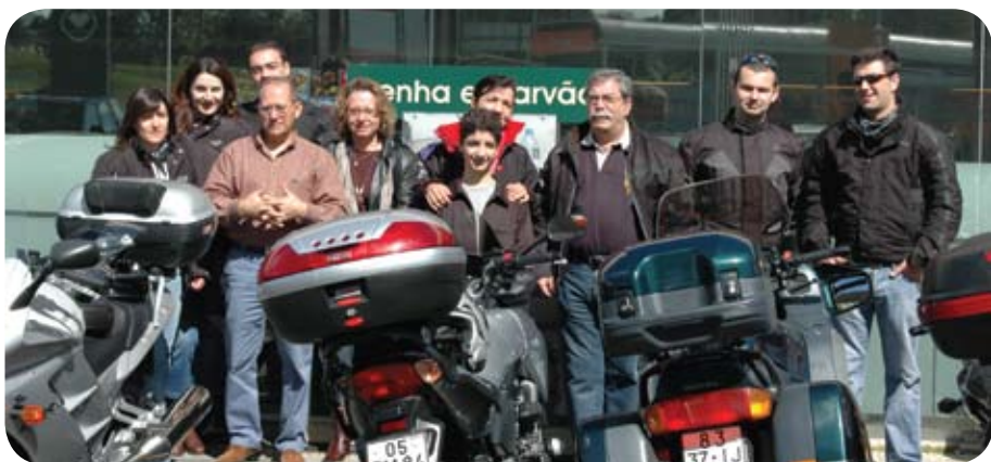
Motards de Lisboa encontram-se para visitar a Expomoto 2008